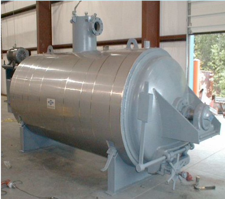
MODELO 160 DISEÑADO PARA HIDROLIZAR PLUMAS